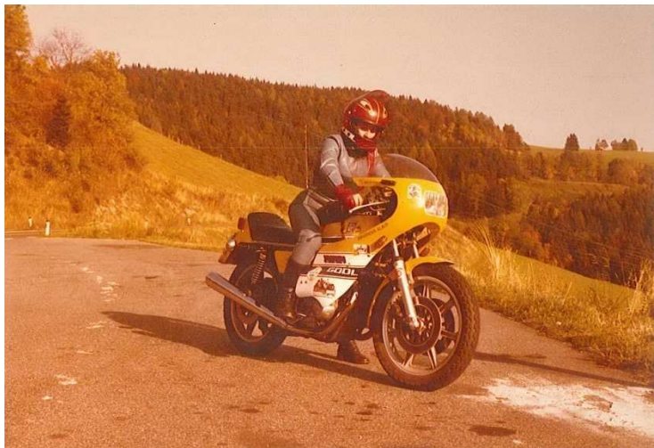
Sie fanden trotzdem noch weiterhin Zeit für ihr gemeinsames Hobby.